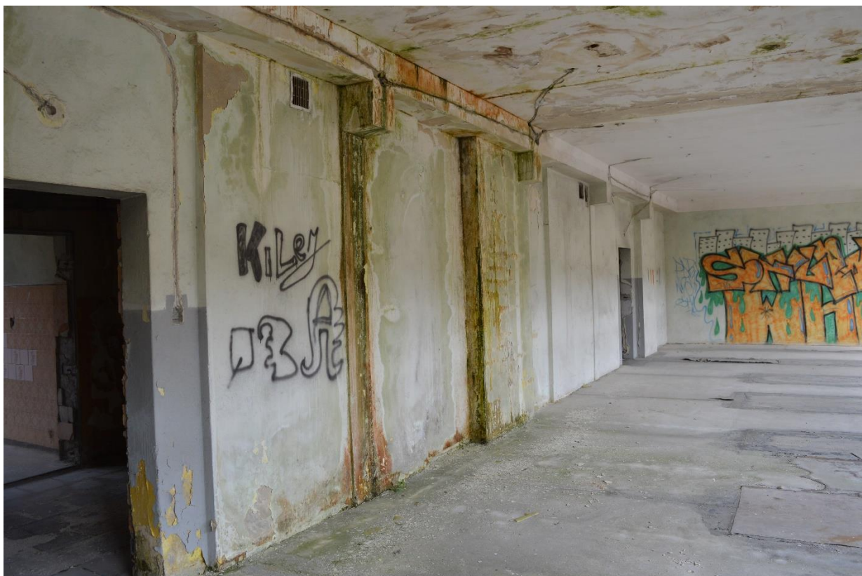
Zdjęcie nr 7 – widok na jedną z istniejących ścian dzielących korytarze od pomieszczeń.