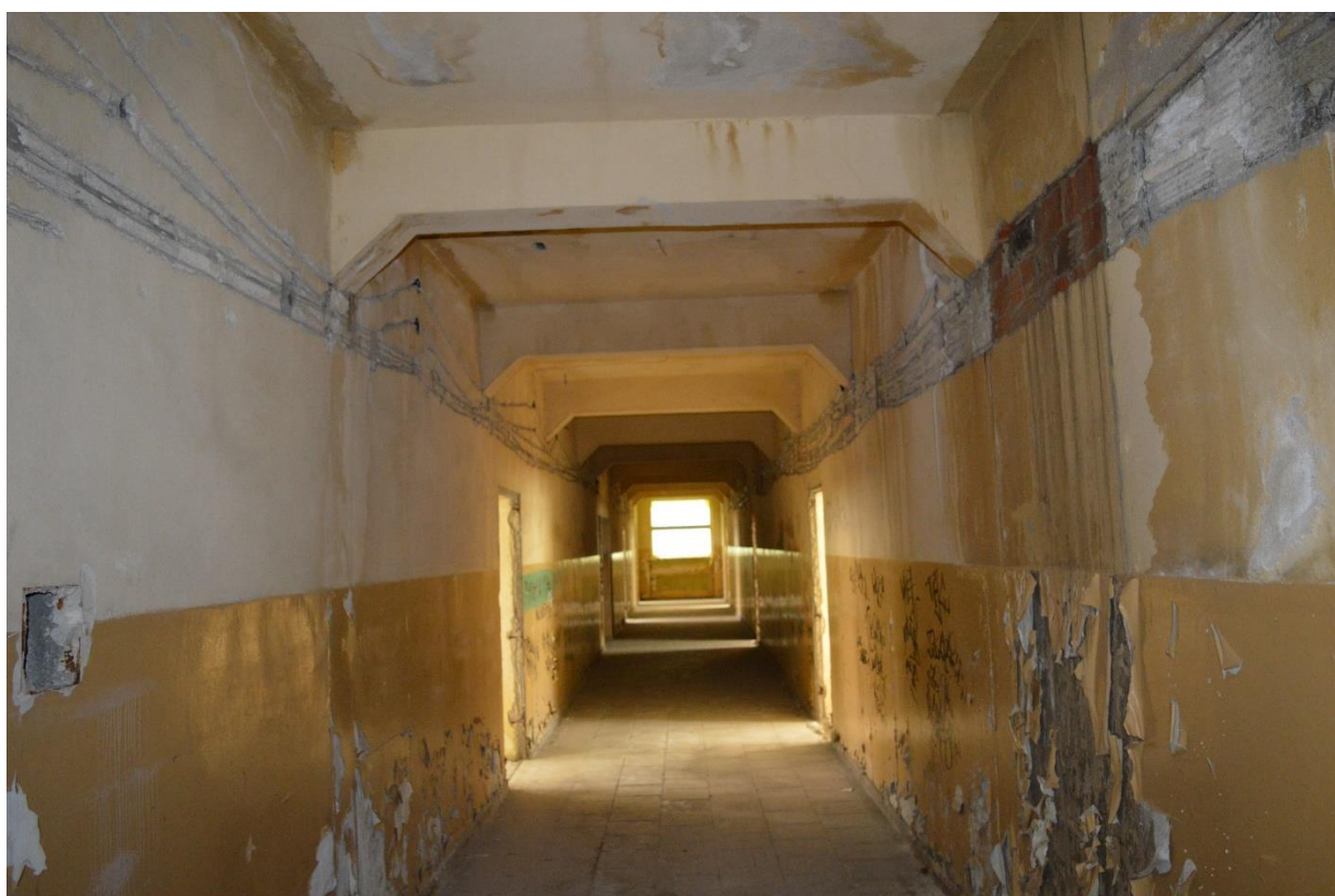
Zdjęcie nr 6 – widok na jeden z korytarzy budynku.