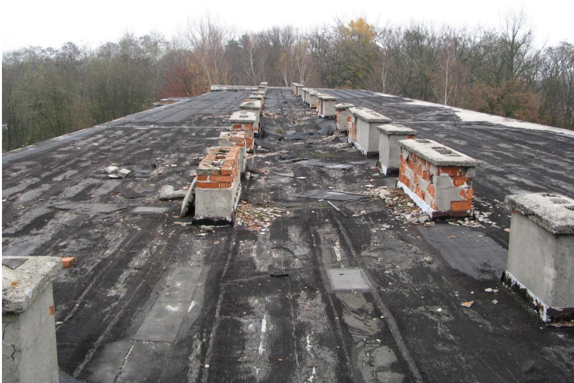
Zdjęcie nr 3 – widok na część stropodachu budynku.