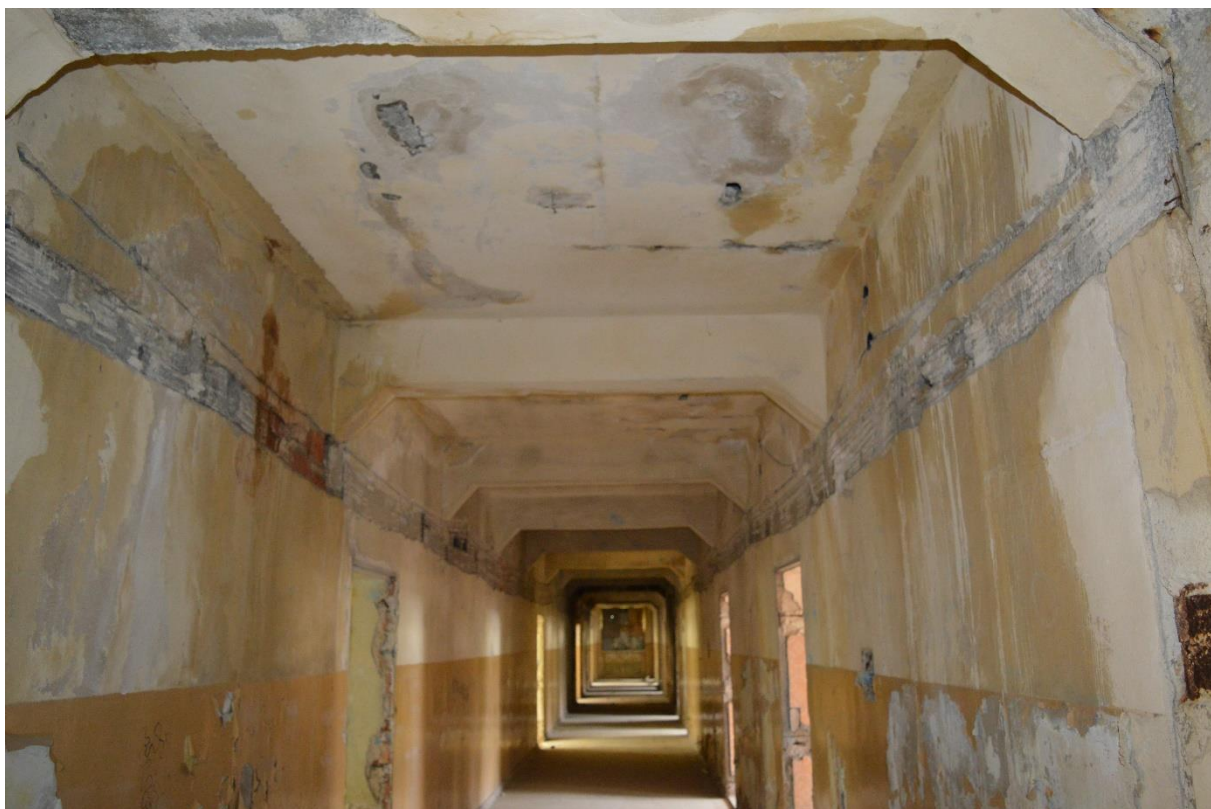
Zdjęcie nr 5 – widok na jeden z korytarzy budynku.