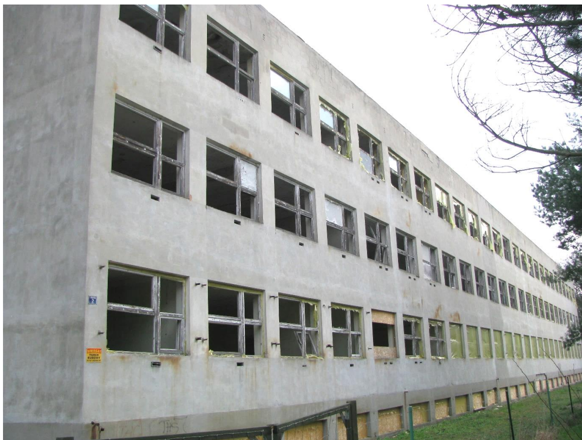
Zdjęcie nr 2 – widok elewacji tylnej budynku.