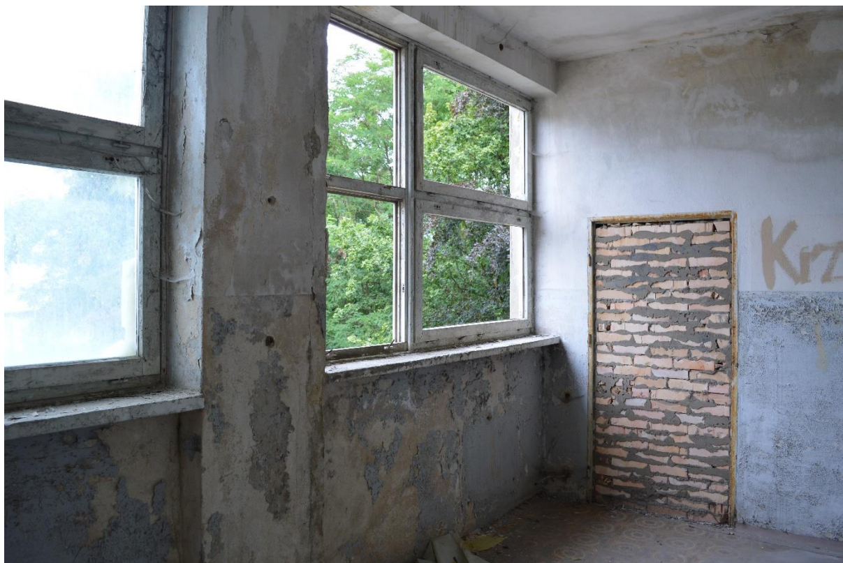
Zdjęcie nr 8 – widok na jedną z istniejących ścian zewnętrznych i działowych (widoczne zamurowania otworów).