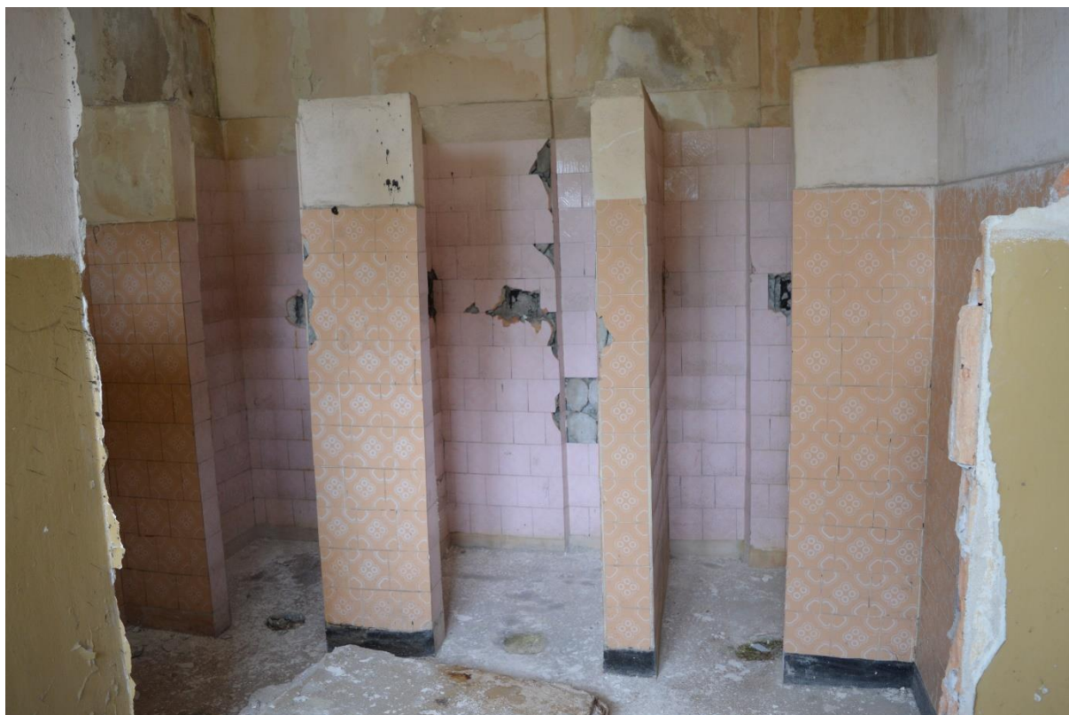
Zdjęcie nr 9 – widok na jedno z istniejących pomieszczeń sanitarnych.