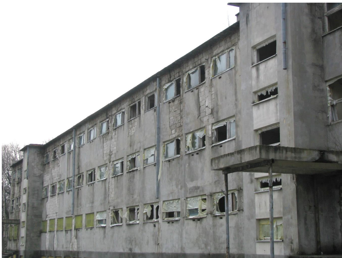
Zdjęcie nr 1 – widok elewacji frontowej budynku.