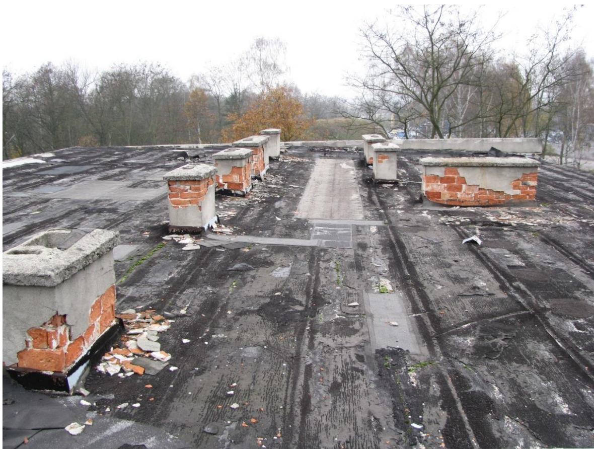
Zdjęcie nr 4 – widok na część stropodachu budynku.